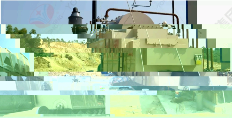
2018.04.28 21t/h DZH manually feeding biomass boiler in Hubei Yongguang Co.,Ltd