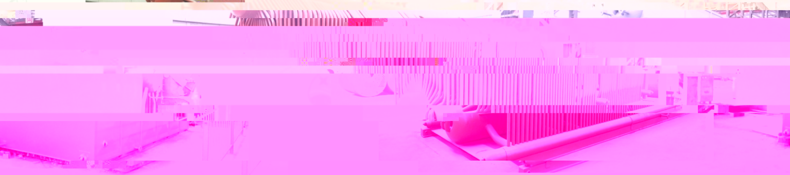
2017.3.27 安徽联众药业股份有限公司10吨生物质蒸汽锅炉 2017.3.27 10t/h biomass steam boiler in Anhui Lianyi Pharmaceutical co. Ltd