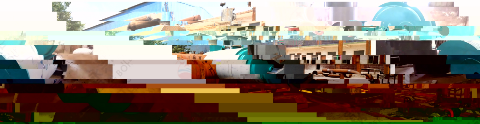
2016.10 浙江温州太和人造革厂80万卡